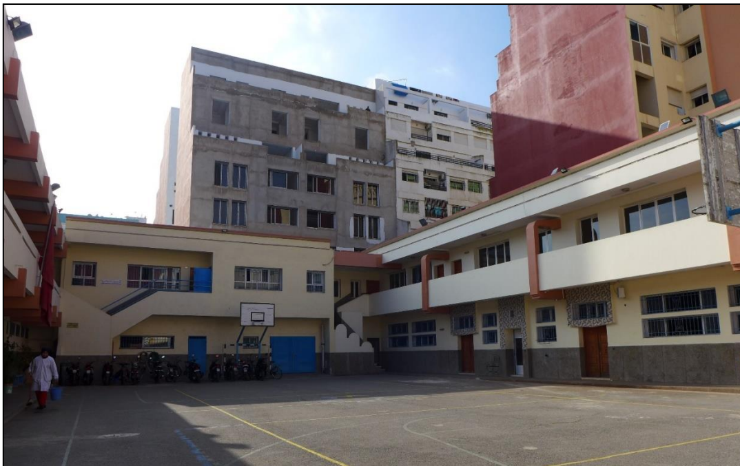
Die Don Bosco Einrichtung in Kenitra